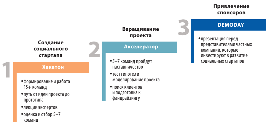
Рис. 2. Этапы создания социального стартапа с использованием механизма хакатона в Беларуси.

Команды соревновались за признание их идеи лучшей, представляя инновационные концепции в сфере социального предпринимательства. Проекты оценивало профессиональное жюри, которое уделяло особое внимание новизне и креативности идей, их потенциалу влияния, качеству презентации и разработке прототипа. Также проходило зрительское голосование.