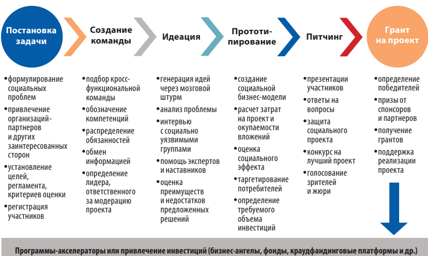
Рис. 1. Механизм хакатона для генерирования инновационных решений социальных проблем.

Также 15 марта 2025 г. в Минске состоялся MALIMON SOCIAL DAY. На нем было представлено 15 социальных проектов, которые предварительно прошли акселератор. Эти стартапы поддерживали белорусские компании МТС, Белагропромбанк, медицинский сервис 103.BY, предприятие по предоставлению автомобилей Ringo.by, ООО «Эвериз Сервис», облачный провайдер ActiveCloud, ЗАО «Водород» и др.