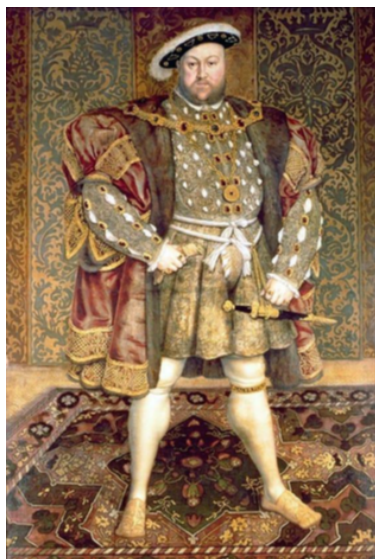
Мал. 1. Партрэт караля Англіі Генрыха VIII мастака Ганса Гальбейна. Вопратка манарха пашытая з адамашку, і сам ён стаіць на фоне насценнай жакарда-вай шпалеры

Спецыфіка жакардавага, тканага ўзору ў апісва-емы гістарычны перыяд заключаецца ў тым, што той, па-першае, выступаў у якасці аднаго са сродкаў канкурэнтнай барацьбы паміж тэкстыльнымі ману-фактурамі ды з’яўляўся плёнам аўтарскай працы