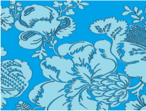
Мал. 5. Фрагмент рапорту шаўковай тканіны XVIII ст. Рэканструкцыя аўтара