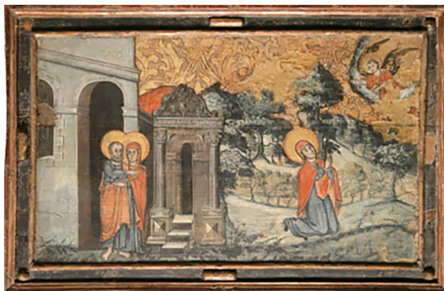
Мал. 2. Ікона «Цялаванне Яўхіма і Ганны і Звеставанне Багародзіцы», 1640–1650-я гг., з традыцыйным для беларускіх абразоў залатым фонам, на якім адлюстраваны жакардавы ўзор