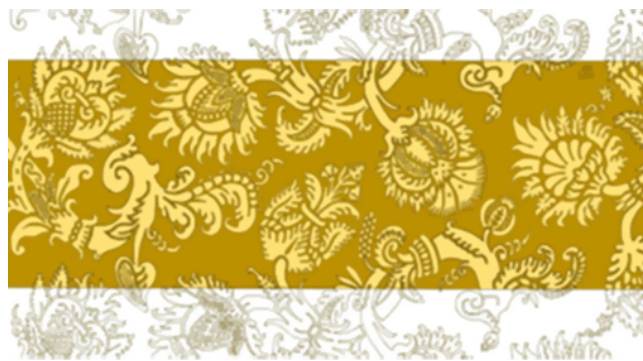
Мал. 4. Рапорт адной з тканін харугвы князя Крыштапа Радзівіла. Рэканструкцыя аўтара

У сучасным свеце, які развіваецца імкліва, тэхналогіі таксама не стаяць на месцы; гэта датычыцца апошніх і ў тэкстыльнай галіне. Вышэй мы ўжо казалі пра вынаходніцтва Жозефам Мары Жакардам ручнога станка, што дазволіў вырабляць жакардавыя тканіны ў вялікіх аб'ёмах. Наступнаю прыступкай па гэтым шляху на сённяшні дзень выступаюць прамысловыя жакардавыя ткацкія станкі з лічбавым праграмным кіраваннем, удзел працы чалавека ў якіх зводзіцца да праграмавання і падрыхтоўкі рапорта ў лічбавым выглядзе ў спецыялізаваных лічбавых фарматах.