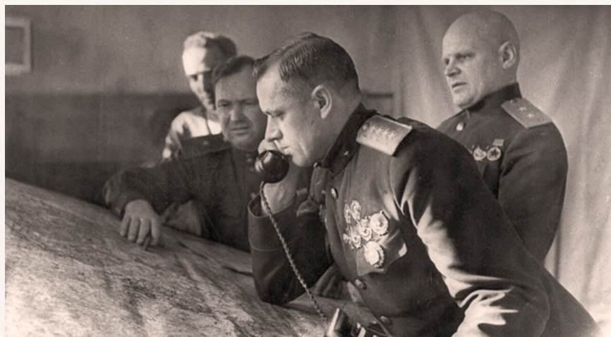
Камандуючы 1-м Беларускам фронтам генерал арміі К.К. Ракасоўскі ў першыя дні аперацыі «Баграціён»

На наступны дзень пасля вызвалення Оршы перадавым падраздзяленнем 3-га гвардзейскага кавалерыйскага корпуса ўдалося фарсіраваць важны водны рубж – Беразіну – і захапіць плацдарм на заходнім беразе. Калі наступленне армій правага крыла і цэнтра 3-га Беларускага фронту разгортвалася даволі паспяхова, то прасоўванне