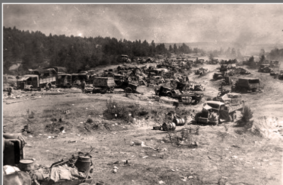
Калона 9-й нямецкай арміі, разбітая ударам з паветра непадалёк ад Бабруйска