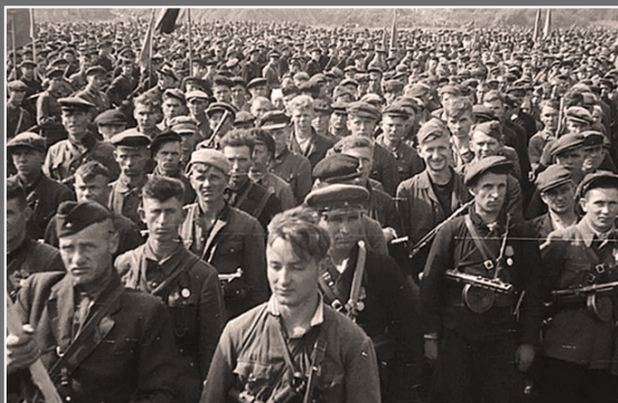
Партызанскі парад у Мінску. 16 ліпеня 1944 г.