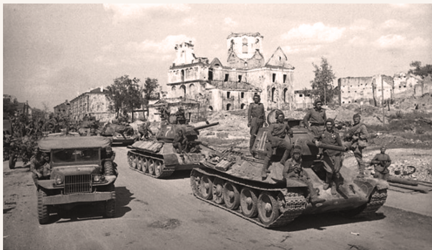
Савецкія танкісты на вуліцах вызваленага Мінска. 28 чэрвеня 1944 г

Адначасова з рухам галоўных сіл правага крыла 1-га Беларускага фронту на Баранавічы, Слонім, Ружаны войскі 61-й арміі ва ўзаемадзеянні з Дняпроўскай ваеннай флатыліяй, партызанскімі злучэннямі Палескай і Пінскай абласцей, апэратыўнай групай умацаваных раёнаў і 55-й стралковай дывізіяй 28-й арміі развівалі наступ па паўночным беразе рэк Прыпяць, Гарынь і Стыр. Пераадольваючы ўпартую абарону праціўніка і шматлікія водныя перашкоды, савецкія воіны за кароткі час вызвалілі райцэнтры Тураў (5 ліпеня), Жыткавічы (6), Ганцавічы і Столін (7), Лунінец (10). Разгром праціўніка ў раёне Баранавіч, дзе паспяхова дзейнічаў 3-ці гвардзейскі стралковы корпус пад камандаваннем генерала Ф.І. Перхаровіча, і на рубяжы р. Шчара