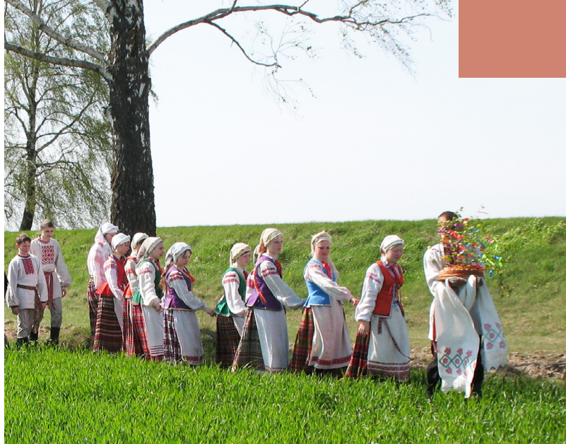
Шэсце моладзі с караваем. Любанскі р-н Мінскай вобл.