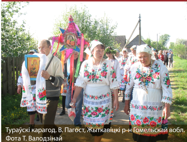
Тураўскі карагод. В. Пагост, Жыткавіцкі р-н Гомельскай вобл.