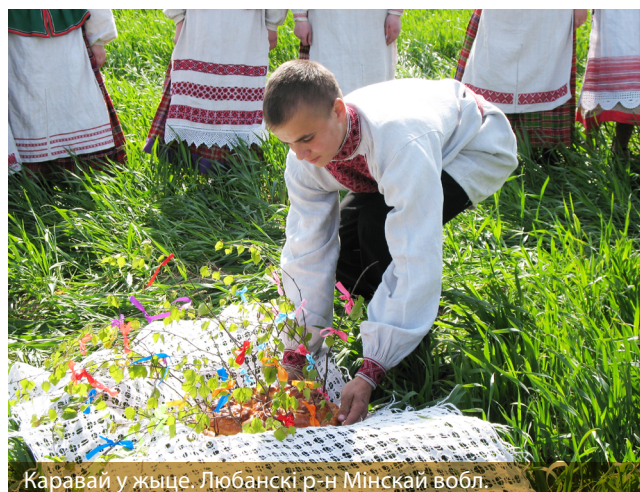
Каравай у жыце. Любанскі р-н Мінскай вобл.

Свята як з'ява адносіцца да ўніверсальных феноменаў культуры і займае адно з цэнтральных месцаў у жыцці чалавека. Яно выступае адным з галоўных паняццяў народнага календара, незвычайным «сакральным» перыядам, які проціпастаўляецца паўсядзённым буднім дням, «прафаннаму часу». Утварэнне двух праславянскіх словаў, якія выкарыстоўваюцца для намінацыі свята ў славянскіх мовах, – prazdъnikъ (рус., паўд.-слав.) і sveto (укр., бел., зах.-слав.) – матывавана важнейшымі для дадзенага паняцця адзнакамі: «бяздзеінасць, парожні, пусты, вольны ад працы час» і «святасць, сакральнасць» [1]. Святы, звычаі і абрады як складнікі традыцыйнай культуры адлюстроўваюць нацыянальны асаблівасці народа, яго этнічную самабытнасць. Захаванне гэтай самабытнасці – адна з надзённых праблем сучаснасці.