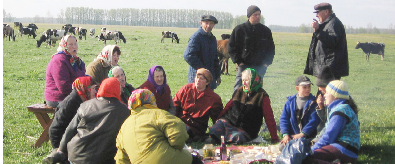
Частанне ў першы дзень выгану статка. В. Закальное, Любанскі р-н Мінскай вобл.

У раёнах, дзе пяклі хрэсцы (поснае печыва ў выглядзе крыжа) і захоўвалі некалькі з іх, пры запасванні кароўкі іх бралі з сабою ў поле. На Брэстчыне да гэтай важнай падзеі выпякалі спецыяльны хлеб. З іншых прадметаў, якія клалі каля ганку хлява ці карове пад ногі, фіксуюцца замочок, сякера або нож, ніты, бязмен. Кожны з гэтых прадметаў меў свой рытуальны сэнс. Выган жывёлы, асабліва на Гомельшчыне, традыцыйна суправаджаўся прыгаворамі. У двары асноўным аб’ектам увагі выступала жывёла, дзеля якой гаспадары выконвалі гэтыя і іншыя абрадава-магічныя дзеянні. Таму выкарыстанне кожнай з рэчаў тут мела сімвалічнае значэнне. Важную ролю ў юраўскай абраднасці адыгрывалі і яйкі, што разам з зернем з’яўляюцца агульнавядомымі сімваламі пастаяннага адраджэння жыцця.