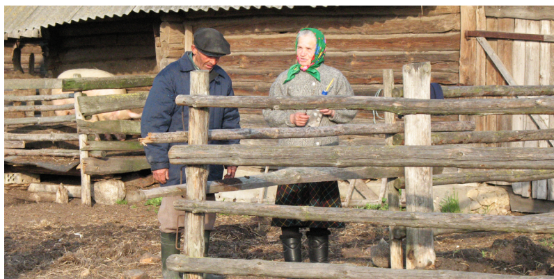
Сяляне рыхтуюцца выгнаць кароўку на Юр’я. В. Закальное, Любанскі р-н Мінскай вобл.