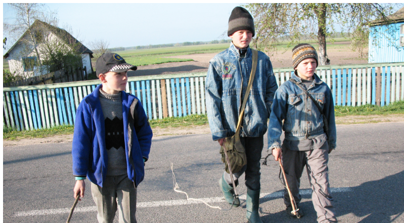
Памочнікі пастуха на Юр’я. В. Закальное, Любанскі р-н Мінскай вобл.