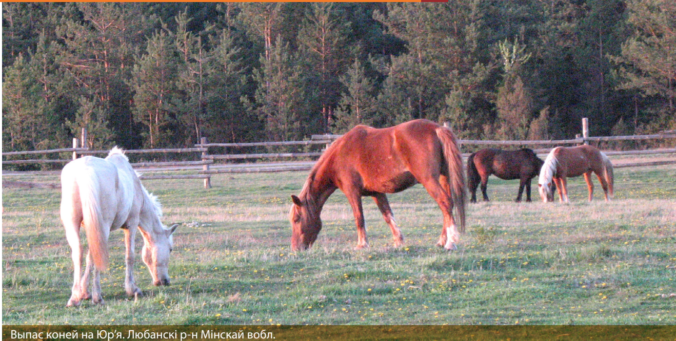
Выпас коней на Юр'я. Любанскі р-н Мінскай вобл.

Яйка, паводле традыцыйных уяўленняў, павінна было забяспечыць будучы прыплод, захаваць на працягу года жывёлу здаровай, для чаго гаспадыня тройчы абыходзіла вакол каровы, абводзіла яйкам па яе скуры; пояс, як лічылі, бараніў жывёлу ад усялякіх пашкодванняў, садзейнічаў таму, каб карова заўсёды вярталася да свайго двара; свянцоная соль выкарыстоўвалася як ахоўны сродак ад сурокаў; замкнуты замок нібыта абараняў ад ваўкоў, «замыкаў ім пашчы»; асвечанымі зёлкамі абкурвалі жывёлу для абароны ад хваробаў; ніты ад кроснаў аберагалі ад укусаў гадзюкі; сякера/нож баранілі ад усялякага зла, а бязмен спрыяў таму, каб жывёла павялічвалася ў вазе.