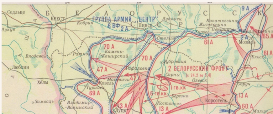
Наступальныя дзеянні 2-га Беларускага фронту 24.02–05.04.1944 г.

Прычыны няўдач войск Заходняга фронту сталі прадметам вывучэння Надзвычайнай камісіі пад кіраўніцтвам члена Дзяржаўнага камітэта абароны Г.М. Малянкова, накіраванай у войскі Стаўкай ВГК. Па выніках яе работы 11 красавіка 1944 г. быў падрыхтаваны спецыяльны даклад, у якім разам з выяўленымі недахопамі былі прапанаваны кадравыя і арганізацыйныя змены ў войсках заходняга стратэгічнага напрамку. Загадам Стаўкі ВГК ад 12 красавіка 1944 г. новым камандуючым войскамі Заходняга фронту быў прызначаны генерал-палкоўнік І.Д. Чарняхоўскі, а 24 красавіка 1944 г.