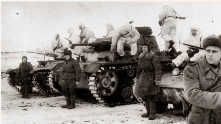
Савецкія войскі на віцебскім напрамку. Канец зімы – пачатак вясны 1944 г.

ад Віцебска. Пераслед праціўніка завяршыўся 3 сакавіка, бо гітлераўскае камандаванне арганізавала на новым рубяжы моцнае агнявое супраціўленне і правяло контратакі. Левафланговя часці 262-й стралковай дывізіі, якія змаглі 4 марта 1944 г. прабіцца яшчэ на адзін кіламетр, у далейшым замацаваліся на дасягнутых рубяжах [1].