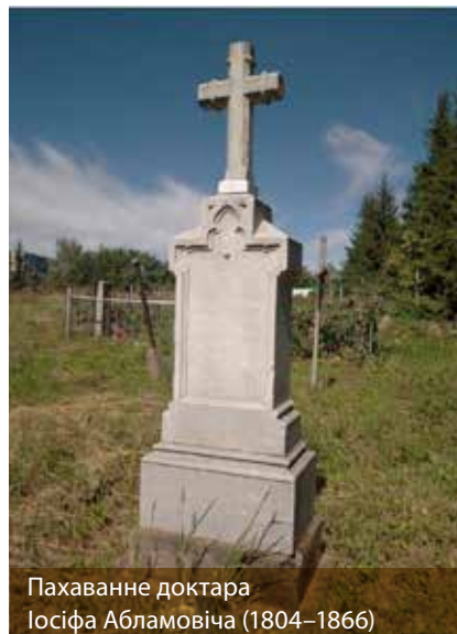
Пахаванне доктара Іосіфа Абламовіча (1804–1866)

Некропаль знаходзіцца ў заходняй частцы горада, займае плошчу 1,4 га. Раней раздзяляўся цэнтральнай алейй шырынёй 4 м, якая ішла ад варот з поўдня на поўнач, на дзве паловы: направа – рыма-каталіцкая частка, налева – праваслаўная.