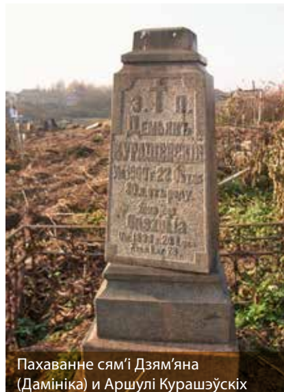
Пахаванне сям'і Дзямяна (Дамініка) і Аршулі Курашэўскіх

Большасць ранейшых помнікаў – рыма-каталіцкія, з надпісамі па-польску, звыш 10 інскрыпцый характэрнызуюцца фрагментарнай прысутнасцю лацінскай мовы, адзін надпіс на беларускай мове (1936, Пётр Рыгравіч Драздоўскі) і адзін арабскай вяззю (? , Канарскі). Руска-польскія інскрыпцыі і эпітафіі, аднолькавыя прозвішчы, напісаныя па-руску і па-польску, – яскравыя прыклады прысутнасці сярод адной сям'і ці роду прадстаўнікоў розных канфесій: Бабраўніцкія, Бакіноўскія, Груша, Курашэўскія, Лагуновічы, Мазуркевічы, Нупрыкі, Рудаміна, Сабалеўскія, Сняжко, Шацукевічы, Шот і інш.