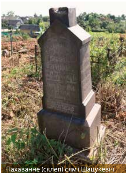
Пахаванне (склеп) сямі Шацукевіч