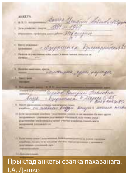
Прыклад анкеты сваяка пахаванага. І.А. Дашко