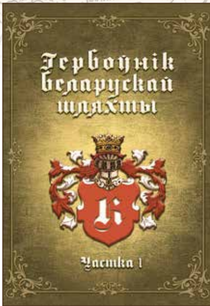
Обложка книги «Гербоўнік беларускай шляхты»