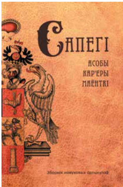
Обложка книги «Сапегі: асобы, кар'еры, маёнты»

Litewskie pod rządami Aleksandra Jagiellończyka: studia nad dziejami państwa i społeczeństwa na przełomie XV i XVI wieku»; М. Лидке «Rodzina magnacka w Wielkim Księstwie Litewskim w XVI–XVIII w. Studium demograficzno-społeczne»; российских М.Е. Бычковой «Русско-литовская знать XV–XVII вв. Источниковедение. Генеалогия. Геральдика», С.В. Полехова «Наследники Витовта. Династическая война в Великом княжестве Литовском в 30-е гг. XV века», М.М. Крома «Меж Русью и Литвой: западнорусские земли в системе русско-литовских отношений конца XV – первой трети XVI в.».