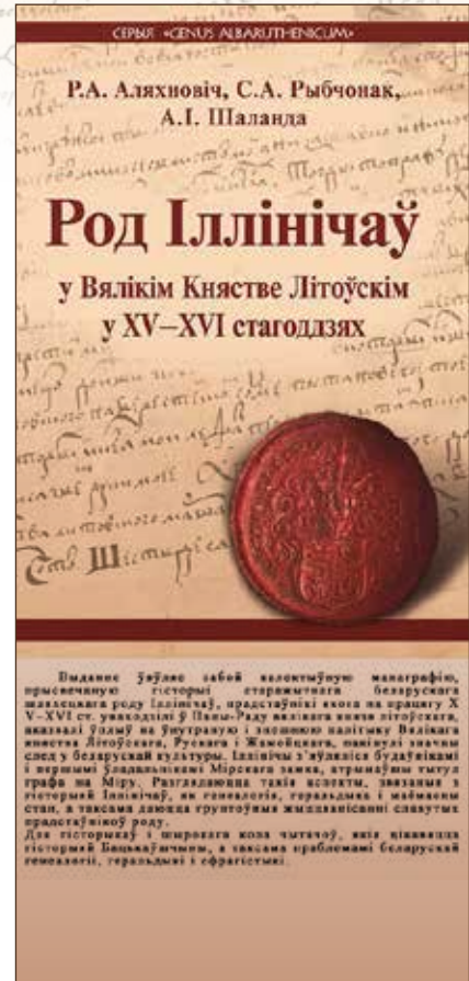
Обложка книги и аннотация Р.А. Аляхновіч. «Род Іллінічаў у Вялікім Княстве Літоўскім у XV–XVI ст.: радавод, гербы, уладанні»

В сборнике 1977 г. «История и генеалогия», ставшем классическим, авторы отмечают, что генеалогическая работа в последние десятилетия (имеется в виду вторая половина XX в. – Н.В.), равно как и связанный с ней жанр исторических биографий, практически остановилась. «Забвение» генеалогии объяснялось вниманием к «процессам», а не к людям, а также тем, что она «в дореволюционные годы скомпрометировала себя пристрастием