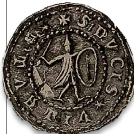
Герб на печатях Витовта, великого князя литовского (1392–1430)

В последние годы получила широкое развитие просопография (от др.-греч. «лицо, личность» и «пишу») – специальная дисциплина, напрямую связанная с генеалогией, изучающая биографии исторических лиц, относящихся к определенной эпохе, местности, социальной страте и имеющих общие (политические, культурные или иные) черты [8]. Подобные изыскания стали весьма востребованными у отечественных и зарубежных историков. Основной базой при этом являются прежде всего массовые источники, содержащие необходимую информацию и открывающие возможности создания «коллективных биографий тех или иных социальных групп при возможности сохранения и изучения биографий отдельных представителей данных социальных общностей».