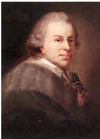
Рис. 1. Александр Михал Сапега. Худ. И. Лампи, 1790 г.