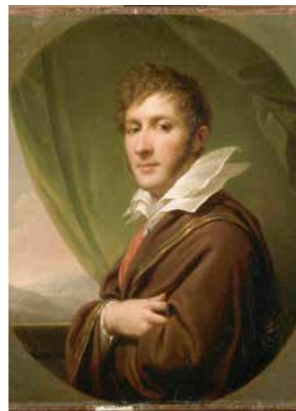
Рис. 3. Франтишек Сапега. Худ. И. Лампи