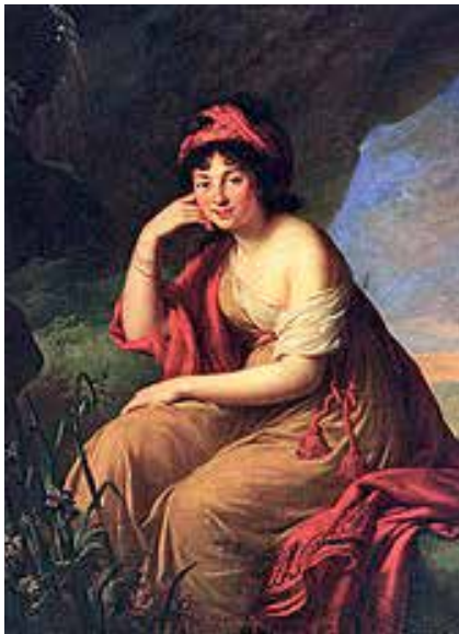
Рис. 4. Пелагея Сапега (из Потоцких). Худ. Е. Виги-Лебрен