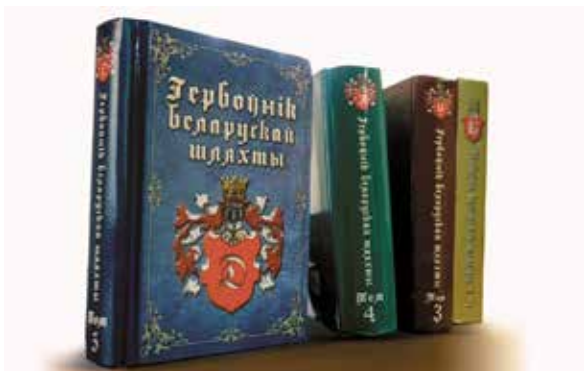
Мал. 1. Гербоўнік беларускай шляхты – самае працяглае беларускае серыйнае выданне, якое ажыццяўляецца ў сферы генеалогіі

Кніга як выбітная адзінка інфармавання і завершаны прадукт дзейнасці свайго стваральніка дамінавала ў грамадстве да з'яўлення Інтэрнэту, надыходу лічбавізацыі, стварэння нейрасетак. Тэхналагічны прарыў значна спрашчае пошук і аптымізуе аналітычную працу з вялікімі масівамі даступных даных. У перыяд, калі друкаваныя сродкі губляюць свой патэнцыял, робячыся выключна дарагой рэпрэзентацый асобы свайго стваральніка, інтэрнэт-рэсурсы, якія могуць накапляцца ананімна, стыхійна і бессістэмна, усё больш запаўняюць сабой інфармацыйную прастору па прычыне лепшай даступнасці ў параўнанні з прадметамі камплектавання архіўных стэлажоў, бібліягэчных і крамных паліц.