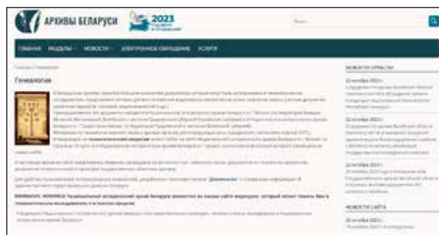
Мал. 2. Архівы Беларусі – афіцыйны сайт беларускай архіўнай галіны