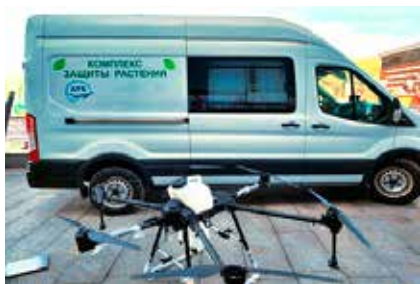
Рис. 5. Мобильный комплекс защиты растений

С целью расширения спектра оказываемых услуг начата реализация совместного проекта с РО «Белагросервис». Заключен договор о выполнении совместных исследовательских и опытно-технологических работ между ЗАО «АТК» и РО «Белагросервис» по практическому внедрению БЛА из состава комплекса защиты растений в интересах сель-