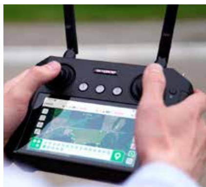
Рис. 3. Пульт управления агродроном А60-Х

Программное обеспечение собственной разработки (рис. 2) с интуитивно понятным и удобным русскоязычным интерфейсом предусматривает возможность загрузки готовых границ полей в универсальном формате KML и создания полетных заданий прямо на экране пульта управления без использования персонального компьютера; расширенный перечень миссий – изменение работы самого дрона