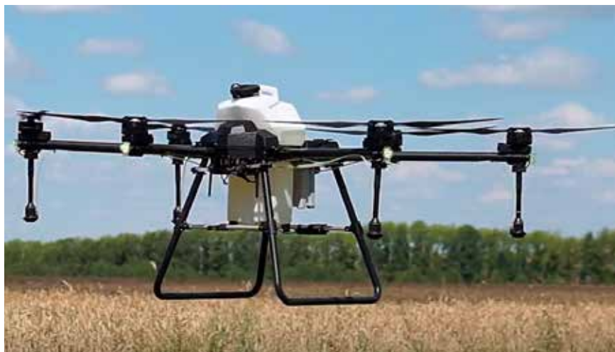
Рис. 1. Опытный образец агродрона А60-Х

В состав комплекта входит БЛА мультироторного типа, аккумуляторная батарея, интеллектуальная зарядная станция с функцией быстрой зарядки, пластиковый бак на 20 л, пульта