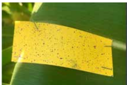
Рис. 4. Распределение средств защиты растений по растительности

мени, затрачиваемого на обработку 1 га, и, соответственно, трудозатрат при использовании БЛА в 3 раза меньше, чем у навесного штангового опрыскивателя «Зубр 600».