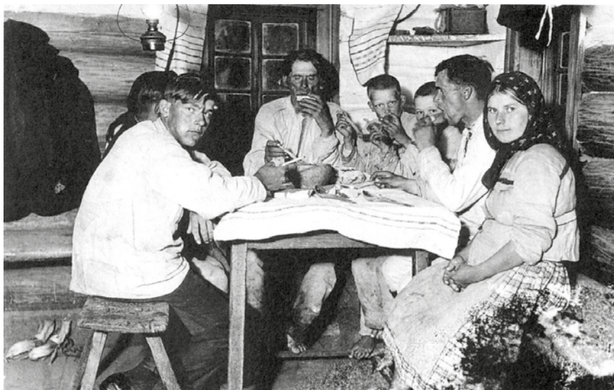
Вячэра на вясеннія Дзяды. Лунінецкі павет. Фота Ю. Абрэмбскага

рэгіёнах значнай была доля вялікіх непадзеленых сем'яў. У народнай свядомасці слова «род» – адна кроў, адзін карань. Ва ўспрыманні дадзенага канцэпту істотную ролю адыгрывае яго асацыяцыя з мужчынскім пачаткам, чаму і адпавядае граматычная катэгорыя мужчынскага роду. Лексема «род» шырока выкарыстоўваецца для абазначэння сацыяльнай групы (сям'і, шэрагу пакаленняў адзінага паходжання).