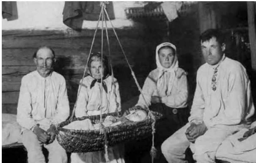
Сям'я каля калыскі, 1937 г.

Падчас балканскага абраду Слава, як і ў беларускім абрадзе Дзяды, успаміналі памерлых дома, пералічвалі іх імёны. Кульмінацыяй Славы з'яўляецца піцца ў час трапезы ў гонар Бога і святога дома. У абрадзе Дзяды, асабліва на пачатку яго правядзення, важнымі з'яўляюцца хрысціянскія малітвы; у той жа час, акрамя сімвалічных элементаў (свечак, рытуальных страў), мела месца непасрэднае запрашэнне душ продкаў роду на трапезу ў іх гонар і большае адчуванне непасрэднай іх прысутнасці. На Дзяды гатавалі адмысловую памінальную страву. У розных лакальных традыцыях гэта «куцця», «канун», «сыта», «коліва». Для балканскага свята хатняга патрона, у якім выражаны культ продкаў, таксама характэрна наяўнасць памінальнай стравы – «коліва» [16, 17].