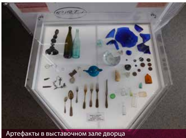
Артефакты в выставочном зале дворца

ляют утверждать, что усадебный дом возник во второй половине XVII в., характеризовать этапы его функционирования, перестройки и развития материальной культуры вплоть до первой половины XX в. [11]. К сожалению, о тематических экскурсиях, лекциях и выставках, посвященных археологическому изучению Меречевщины и Коссовской резиденции Пусловских, говорить не приходится, хотя подобные работы по другим тематикам ведутся: с 2007 по 2018 г. сотрудники музея прочитали 85 лекций. Закономерно, что в основном они были посвящены истории жизни и деятельности Тадеуша Костюшко. Небольшая доля касалась истории Коссовского дворца и теме архитектуры шляхетских резиденций. С 2006 по 2018 г. в музее прошло 96 выставок разнообразной тематики [8]. Можно отметить временную выставку, открытую в ноябре 2017 г. в центральном корпусе реставрируемого Коссовского дворца, посвященную роду Пусловских и истории функционирования самого здания. Основу вещевого экспозиционного материала составила коллекция, собранная в ходе археологических исследований Коссовской резиденции в период