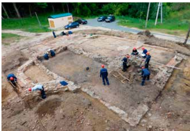
Раскопки дома поветового сеймика, общий план, 2019 г.