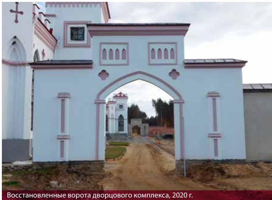
Восстановленные ворота дворцового комплекса, 2020 г.

На основе иконографических источников (рисунков М. Кулеша и Н. Орды, фотоматериалов первой