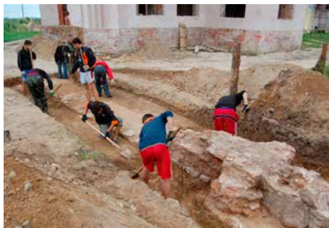
Раскопки западных ворот, 2011 г.