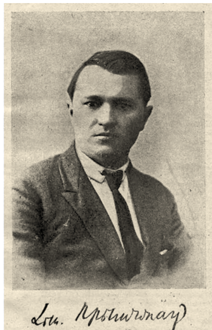
Д.Ф. Прищепов. Иллюстрация из журнала «Наш край»

После переименования Агрономической секции в Сельскохозяйственную в 1925 г. был значительно расширен фундаментальный компонент исследовательской программы. Теперь она включала изучение истории сельского хозяйства, права и земельных отношений, экономики и кооперации отрасли. Был сделан акцент