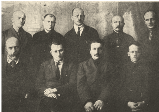
Сельскохозяйственная секция. Иллюстрация из журнала «Наш Край»