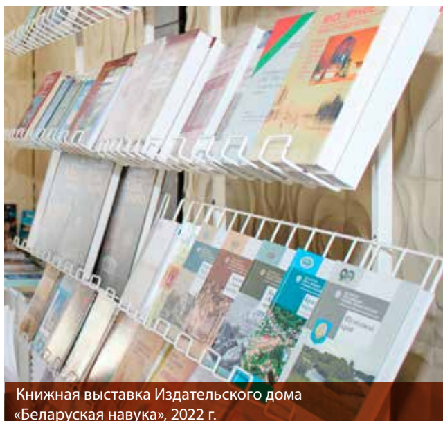
Книжная выставка Издательского дома «Беларуская навука», 2022 г.