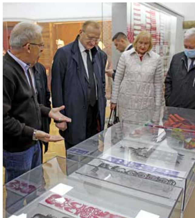
Посещение Председателем Президиума НАН Беларуси академиком В. Гусаковым Музея древнебелорусской культуры