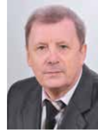
Александр Коваленя, академик-секретарь Отделения гуманитарных наук и искусств, академик