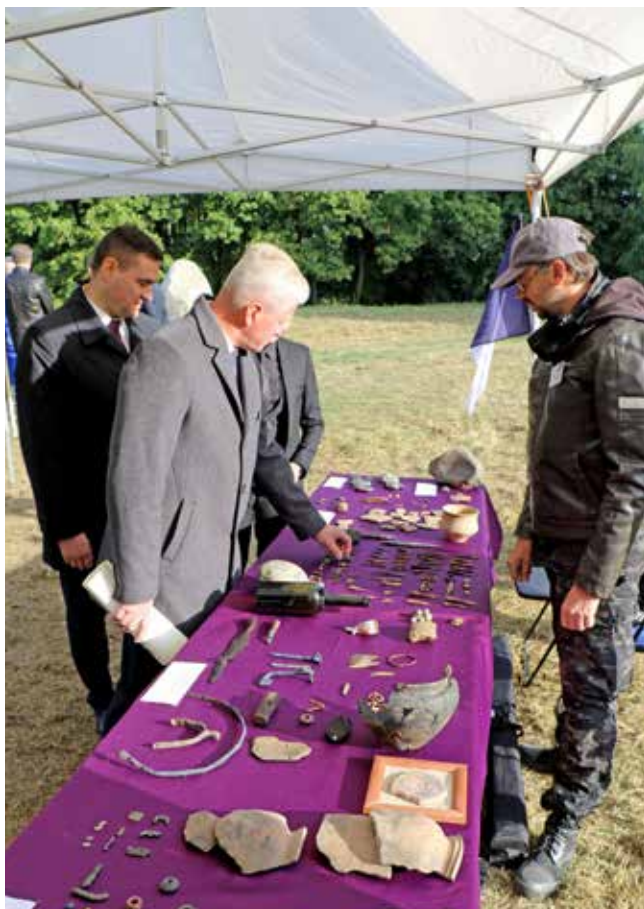
Міністр асветы Рэспублікі Беларусь А. Іванец і міністр культуры Рэспублікі Беларусь А. Маркевіч знаёмяцца з знаходкамі акадэмічных археолагаў (раскопкі гарадзішча Менка)

Дзякуючы творчым намаганням вучоных АДДЗЯЛЕННЯ ГУМАНІТАРНЫХ НАУК І МАСТАЦТВАЎ НАН БЕЛАРУСІ былі дасягнуты бачныя вынікі: апублікавана звыш 7300 навуковых прац (без уліку тэзісаў), з іх амаль 1600 – у замежных навуковых выданнях. Падрыхтавана і выдадзена 679 кніжных выданняў, у тым ліку 274 манаграфіі, 131 даведнік і энцыклапедыя, 188 зборнікаў навуковых прац. Распрацавана 86 падручнікаў, навучальных і метадычных дапаможнікаў, працоўных сшыткаў, навучальных карт. Падрыхтавана і апублікавана звыш 6500 навуковых артыкулаў