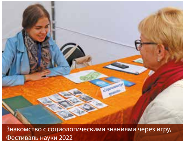
Знакомство с социологическими знаниями через игру, Фестиваль науки 2022

Акрамя гэтага вучоныя-эканамісты прымалі актыўны ўдзел у экспертна-аналітычным забеспячэнні дзейнасці органаў дзяржаўнага кіравання краіны: кожны год выконвалася больш за 300 буйных і працаёмкіх даручэнняў, звязаных з падрыхтоўкай аналітычных матэрыялаў па пытаннях функцыянавання нацыянальнай эканомікі і выпрацоўкай прапаноў па ўдасканаленні эканамічнай палітыкі рэспублікі.